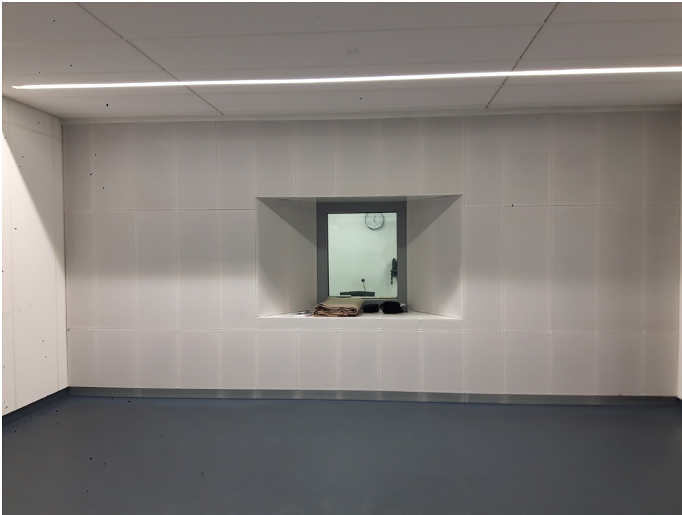
Die Abbildung zeigt die Zuluftquellwand der Raumschießanlage in Ainring-Mitterfelden.